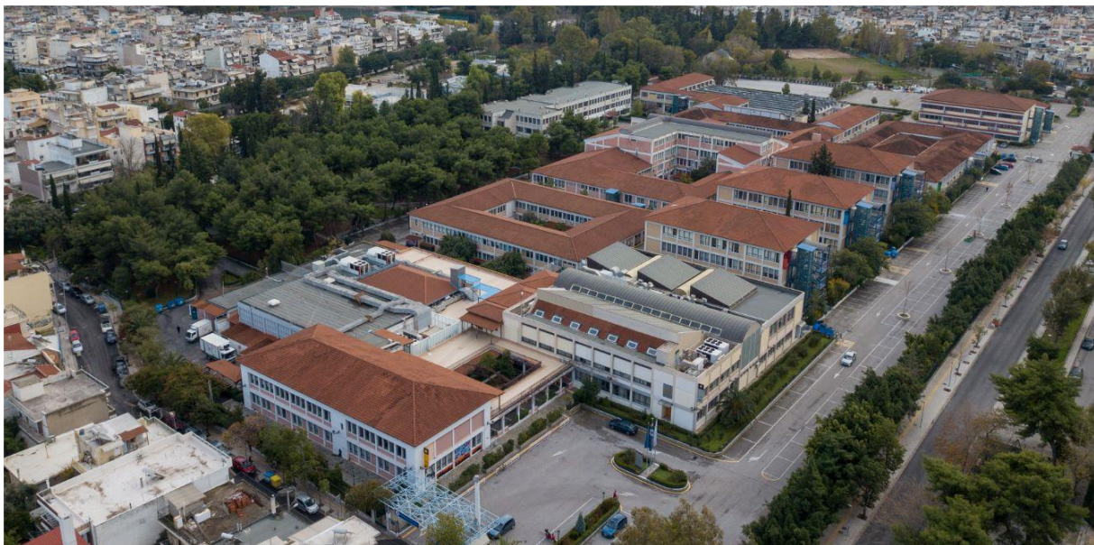
Αεροφωτογραφία της Πανεπιστημιούπολης Άλσους Αιγάλεω