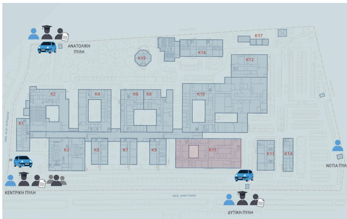
Διάγραμμα κτιρίων Πανεπιστημιούπολης Άλσους Αιγάλεω

Οι πύλες στις οποίες επιτρέπεται η πρόσβαση είναι οι παρακάτω: